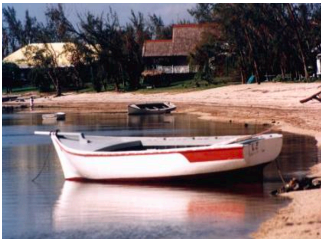
ריבייר נואר, המקום שבו הסירה עצרה ואינן נותר.

בצרה רצינית. כשהתקרבנו לחוף, החלתי לראות מטושטש, התקשיתי לראות בבירור. הגענו לחוף, נעמדתי כדי לצאת מהסירה ורגלי הימנית קרסה תחתי. נפלתי ישר על הלובסטרים שהיו בתחתית הסירה. הנער נעמד לאחור, מופתע מעט, ואז סימן לי להניח את זרועי עליו. השלכתי את זרועי סביב צווארו ואחזתי בו בחוזקה. הוא גרר אותי החוצה מן הסירה ולאחר מכן במעלה החוף שעל חול האלמוגים. הוא הצליח להביא אותי אל הכביש הראשי. השעה הייתה בערך חצות. המקום היה שומם - שום מכוניות, כלום. נאחזתי בנער ותהיתי כיצד לכל הרוחות אצליח להגיע לבית החולים בשעה כה מאוחרת בלילה. רגלי הימנית הייתה כה חלשה שהתיישבתי על האספלט. הנער ניסה לעזור לי, אבל לבסוף, הוא הצביע אל הים שוב ואמר, "האחים שלי, אני צריך לחזור לקחת אותם". אמרתי, "לא, תשאר פה ותעזור לי". ידעתי שהאחרים יוכלו לשחות חזרה מהשונית בבטחה כיוון שהמדוזות היו מחוץ לשונית. אבל הוא עזב, ונשארתי לבד בצד הדרך באמצע הלילה. התקווה אזלה לי, ושכבתי לנוח.