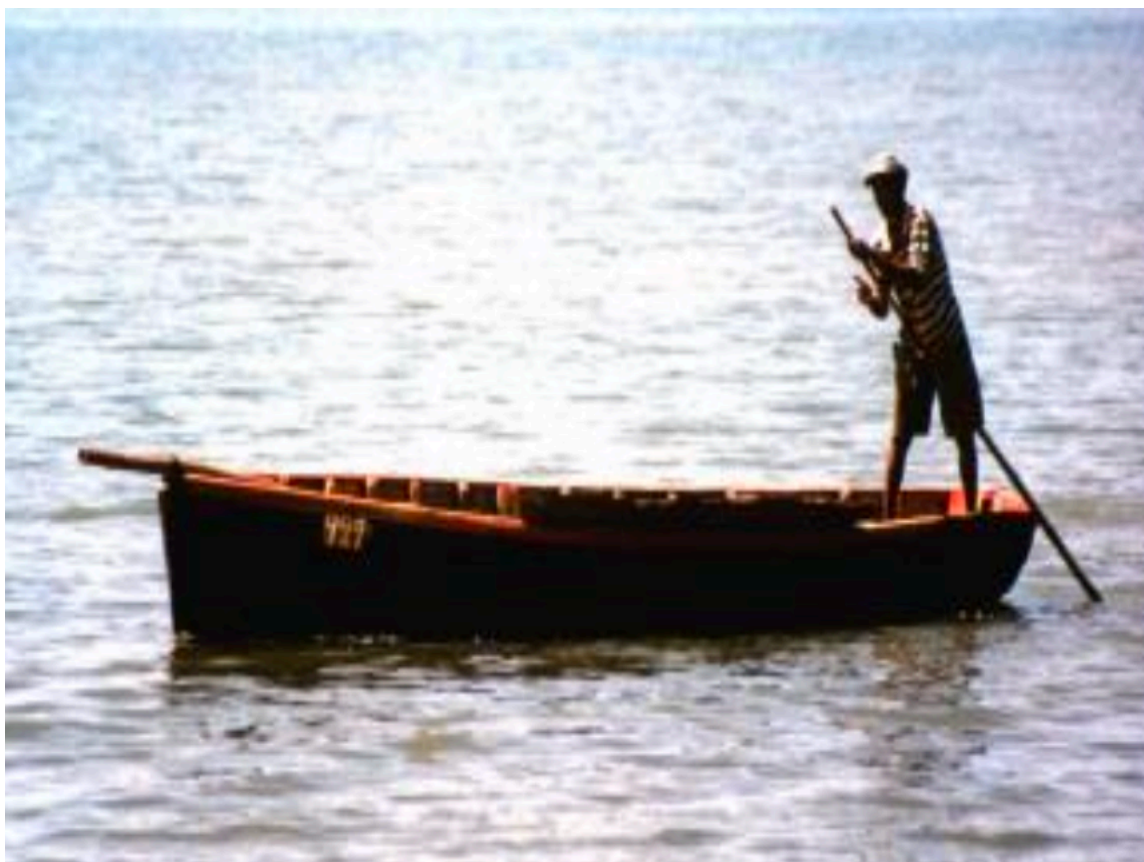
סירת עץ במאוריציוס

אמרתי, "בואו איתי!" אך הם השיבו, "לא, זה כבד מדי, תגיד לנער שיקח אותך לחוף". אז הנער דחף את הסירה לעבר החוף עם מקל.