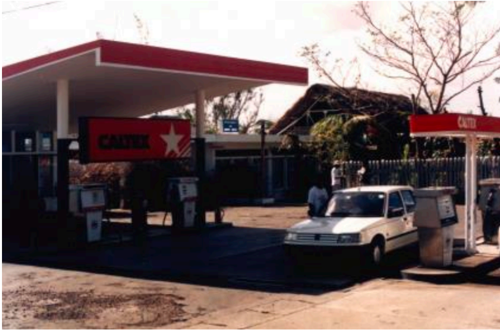
תחנת הדלק שבה איאן התחנן על חייו.

ואז שמעתי שוב קול ברור אומר: "איאן, האם אתה מוכן להתחנן על חיידך?" ברור שהייתי מוכן! וגם ידעתי בדיוק איך לעשות זאת. חייתי בדרום אפריקה מספיק זמן. ראיתי את הגברים השחורים כופפים את ידיהם ומשפילים את ראשם בפני הגברים הלבנים ואומרים "כן אדוני הבוס, כן אדוני". היה לי מאוד קל לרדת על ברכיי כיוון שרגלי הימנית כבר הייתה משותקת, ורגלי השמאלית הייתה רועדת. נשענתי על האוטו, ואז החלקתי למטה על ברכיי וכופפתי את ידיי. הרכנתי את ראשי, התחננתי על חי. כמעט התחלתי לבכות. ידעתי שאם לא אגיע לבית החולים בקרוב, אני לא הולך לשום מקום. אם לבחורים האלה לא הייתה חמלה ואהבה בליבם ורחמים עבורי, הייתי מתמוטט ומת מול עיניהם.