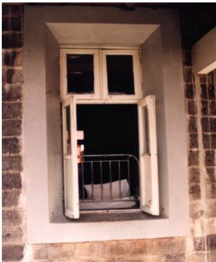
איאן מחוץ לבית החולים ב-1994

לא רציתי לומר, "למעשה - מתת!" עדיין ניסיתי להשלים עם כל מה שקרה, ולא רציתי שיאמרו, "קדימה, אותך לחדר המשוגעים - לקחת יותר מדי סמים וזה כבר יוצא לך מכל החורים!" "המקום הזה מריח כמו לטרינה", הם אמרו. "אנחנו מוציאים אותך מפה. אנחנו נדאג לך." ניסיתי להתנגד - רציתי להישאר בבית החולים, אבל הם טיפסו דרך החלון, הרימו אותי והוציאו אותי החוצה. הרופא הגיע וניסה לעצור אותם בגופו, אך הם הדפו אותו מדרכם.