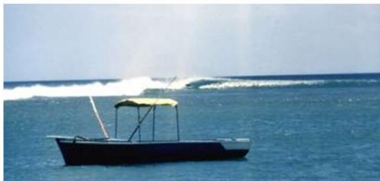
毛里求斯的冲浪点

在留尼汪岛中转时，我偶然发现了一处绝妙的浪点——圣勒，独自享受了几波超棒的海浪后，紧接着前往毛里求斯。那时是 1982 年 3 月，我已经在外漂泊快两年了，经常睡在海滩的帐篷里，活像个流浪汉。真的是该回家了。