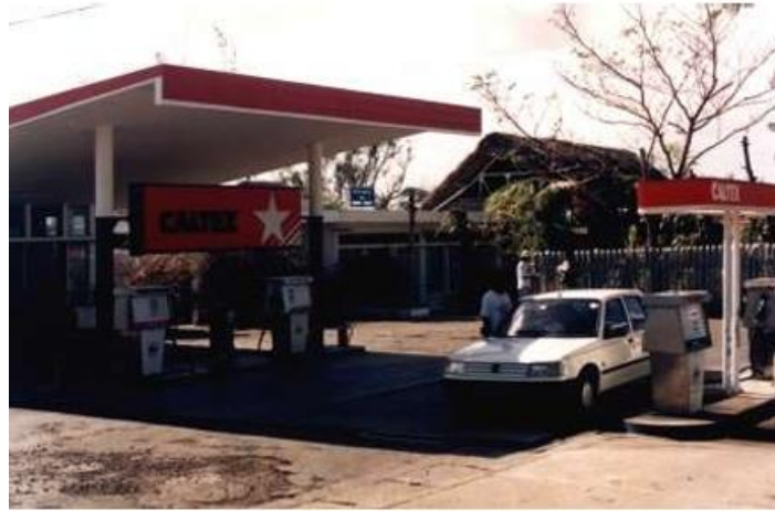
以恩下跪求救的加油站

跪下的动作毫不费力——右腿早已瘫痪，左腿也抖得厉害。我靠着车门滑跪在地，双手作乞求状，低垂着头不敢直视他们，声音几乎带着哭腔：“求求你们...”我知道，若不能尽快赶到医院，这就是我的葬身之处。若这些人心底没有半点怜悯，我将直接死在他们眼前。