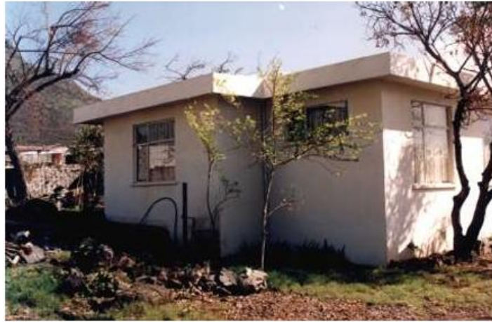
以恩当晚栖身的平房后屋

最后一晚，行李收拾妥当，我躺在床上等著凌晨五点的出租车。刚睡着，又被石子砸窗声惊醒——又是那个女孩！