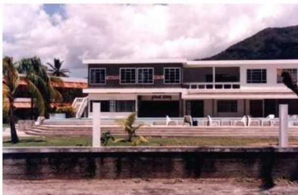
塔马林湾的旅游酒店

这样的见死不救，使我愤怒的想挥拳相向，可双臂早已不听使唤，连用头撞他的力气都不敢使——怕肾上腺素加速毒发。