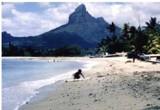
毛里求斯的塔马林湾

后来我重返阿鲁甘湾，兴奋地获准加入一艘 27 米长的纵帆船"星座号"担任船员。某个午夜，我们从斯里兰卡启航驶向非洲。历经二十六天的海上航行后，终于抵达毛里求斯的路易港。