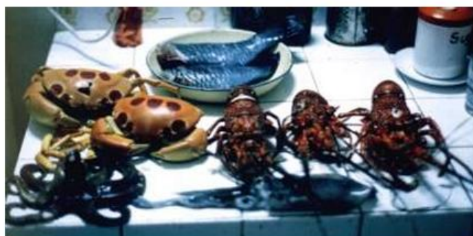
每日典型的海鲜捕获

在毛里求斯期间，我寄居塔马林湾，与当地的克里奥尔渔民和冲浪者共同生活。大麻成为我们之间的链接，他们接纳我融入社群，并教会我在外礁进行夜潜。夜潜是种绝妙体验——龙虾夜间出没，用水下手电筒照射其眼睛便能轻松捕捉；鱼类入眠后，只需挑选心仪的品种叉取作为晚餐。这项刺激的活动让我们得以将渔获出售给周边旅游酒店。