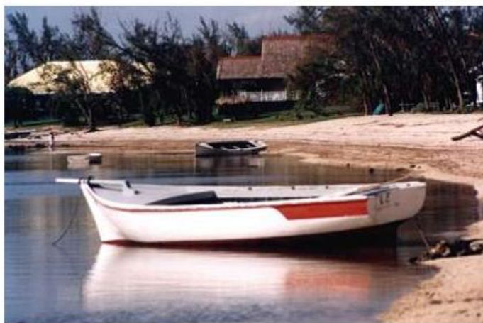
黑河镇（Rivière Noire）——船只靠岸后，以恩被独自留下的地方